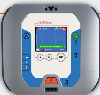
imPulse PRO АНД-П01