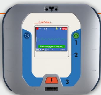
imPulse LCD АНД-П05